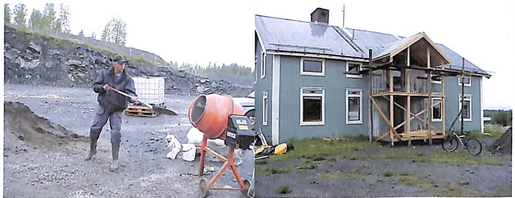
Torbjörn Österman på ett av sina många arbeten, stenbrottet, Norsåker och smedjan.

Norsåker ska också bli klart innan sommaren är över. "De è mycke nu" Se sid. 2.