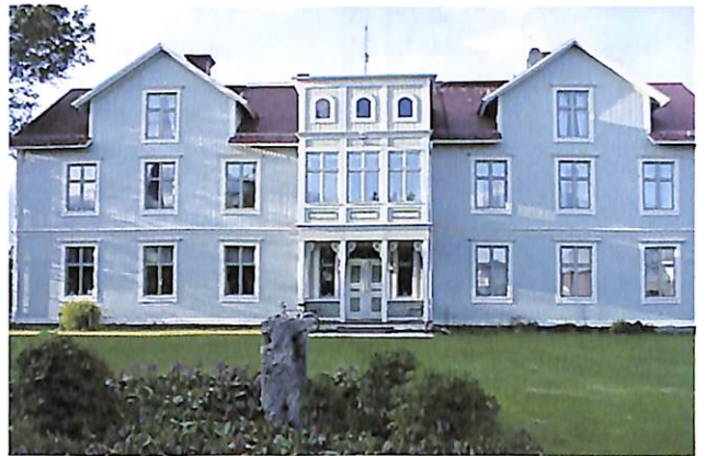
Bakom de tre fönstren till vänster om entrén ligger den lediga fyrrummaren med sjöutsikt

Mats-Olof Hansson, tfn 0670-611187 eller 070-6583980.