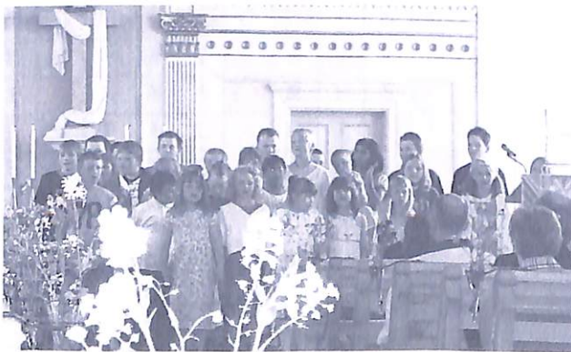
Vårterminsavslutning för Gåxsjös 31 elever