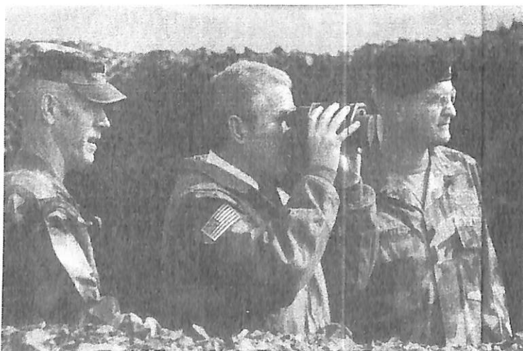
Bush på spaning med linsskydden på!